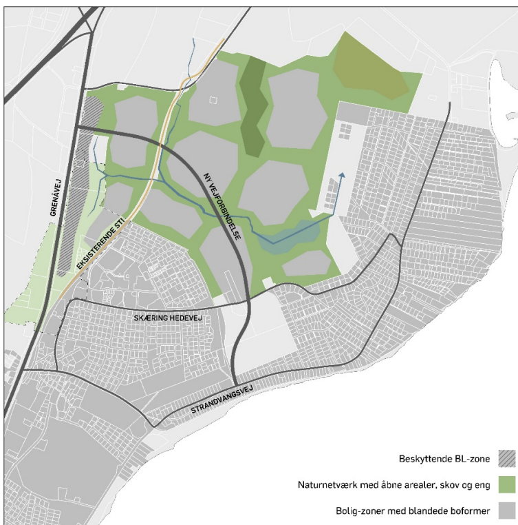
Figur 2 – Eksempel på hvordan grønne tiltag kan blive mere tilgængeligt for hele Skæring

Infrastrukturen var en stor bekymring blandt høringsvar til temaplanen i 2021. Den høje belastning der i dag opleves på Skæring Hedevej blev sat i centrum som et argument mod yderligere byudvikling. Vi har gennem forstudier konkluderet, at en ny vejforbindelse fra Grenåvej til Skæring Hedevej ikke blot vil tjene ny byudvikling, men også aflaste det nuværende vejnet i Skæring. Vi er dog bevidste om udvikling over tid, og mener at området kan ses som etapevis naturlig udbygning fra vest mod øst, hvor de første arealer udelukkende kobles direkte på Grenåvej og således holder sig på vestsiden af cykelstien (jf. figur 3). I øvrigt er vi af den overbevisning at den korte afstand til Aarhus, vil styrke et fremtidsscenario med reduceret privatbilisme og øget fokus på cykelforbindelser.